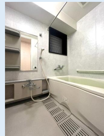
爽快快適バスルーム 換気窓付き