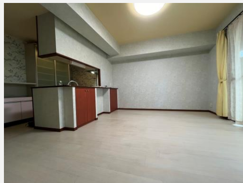
南西向き、ハイサッシュの明るいLDK