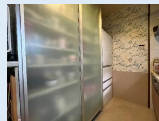
専用カップボード付き