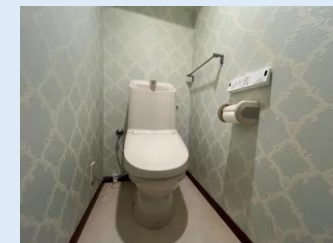
温水洗浄便座付きトイレ