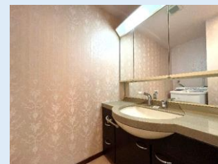
3面鏡タイプの洗面台