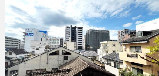
都心でありながら遮るものが無く とても明るいお部屋です