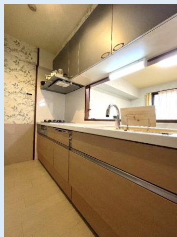
人気のカウンタータイプ システムキッチン 食器洗浄乾燥機付き