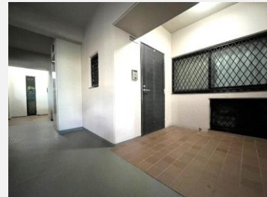
専用ポーチもあるゆとりの玄関周り