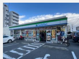
ファミリーマート徒歩3分