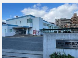
南市民プールとなり