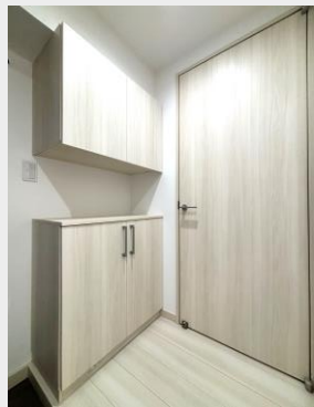
大容量のシューズボックスを