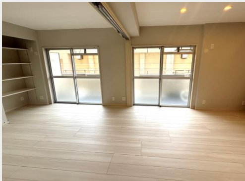
ココの仕切りは取外しが可能 ご家族数に応じて広タリビングにも 出来ます！