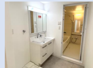
シャワーヘッドを備えた洗面台