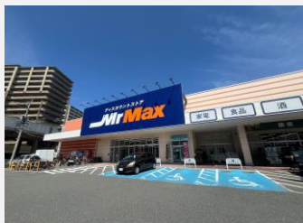
ミスターマックス となり