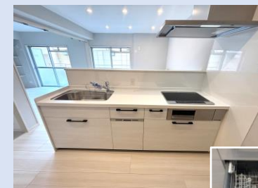
オープンタイプで開放的 食洗機付のシステムキッチン