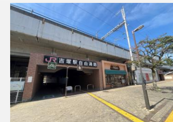
J R 吉塚駅 徒歩 6 分