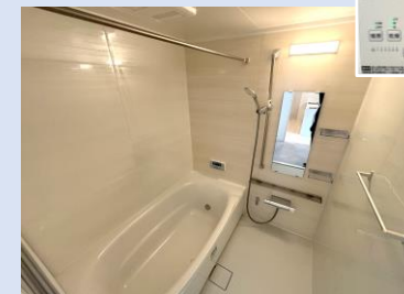
新品の浴室は浴室乾燥機付！