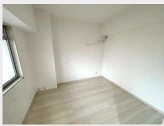
フローリング貼替済 とてもキレイなお部屋です