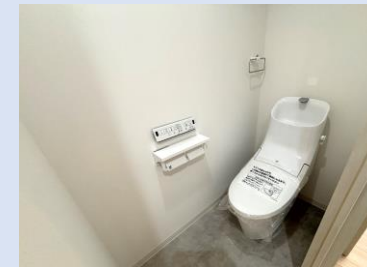
温水洗浄便座付きトイレ